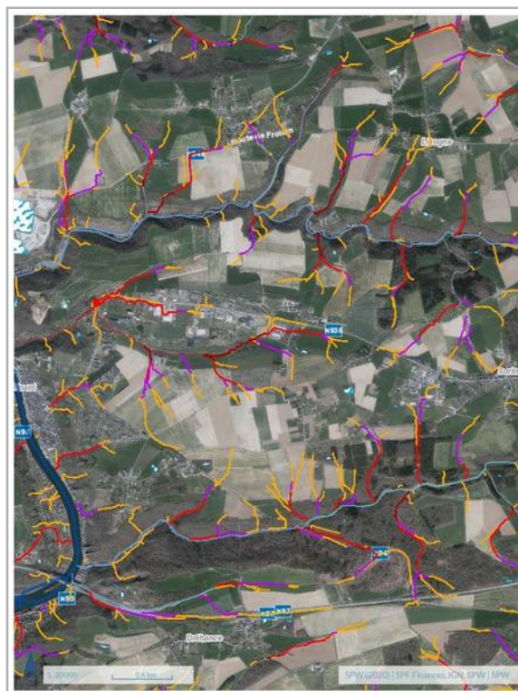
Les lignes de concentration des eaux de ruissellement

Ce qui doit nous interpeller, c'est l'importance des précipitations très localisées et aussi le changement de chemin des eaux de ruissellement des Fonds de Bouvignes ? La main de l'homme joue-t-elle un rôle dans ces phénomènes destructeurs ?