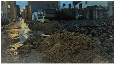
Le déblaiement a immédiatement commencé à Bouvignes