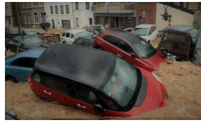
Voitures encastrées au passage à niveau, route de Philippeville.

Au niveau du local, nous avons eu relativement de la chance. L'eau est entrée dans la boutique par la porte du couloir qu'un locataire du haut avait laissée ouverte. La boue et l'entrée indirecte ont probablement freiné la propagation de l'eau. Ni l'espace d'accueil, ni la cuisine n'ont été atteints. Par contre, le sous-sol a été inondé sur toute sa longueur. Mais encore une fois, nous avons eu de la chance. Le stock installé sur des palettes n'a pas été atteint. L'eau s'est écoulée vers la « salle des coffres » en béton armé et sans évacuation. Vu que cette salle polyvalente est l'endroit le plus bas du bâtiment, rien n'y est stocké au sol. Malgré les 20 cm d'eau, en dehors de deux totems en frigolite qui ont basculé, rien n'a été perdu. Seuls les pieds des chaises et des tables ont été inondés.