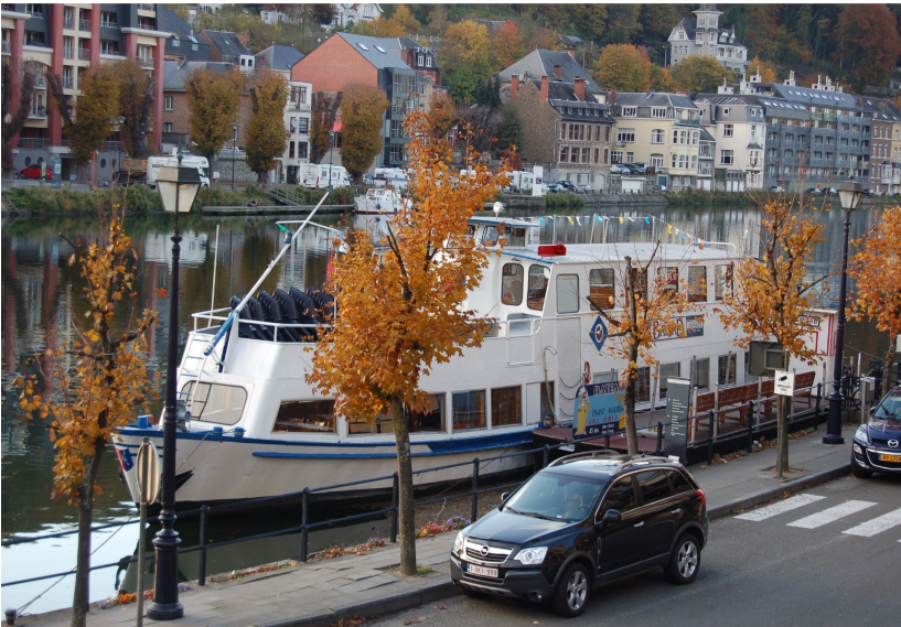
En bas, photo prise sur le boulevard Sasserath et en haut, le même boulevard vu à partir de la rive opposée.