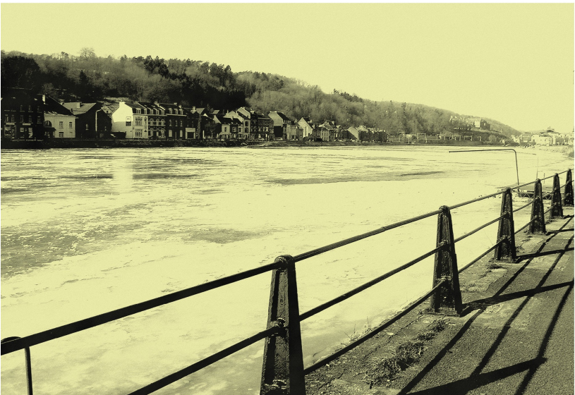
L'église du quartier du Rivage, le rocher Bayard, le viaduc Charlemagne. En bas Neffe, vers Dinant.