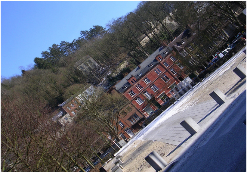
En haut, le collège de Belle-Vue, derrière les arbres. En bas, la place d'armes.