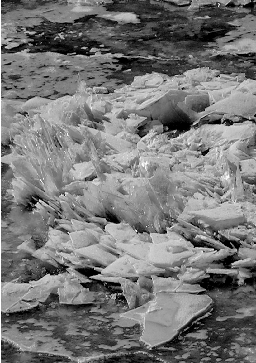
Une rose de glace, un plaisir éphémère et rare. C'était sur la Meuse en 2012.