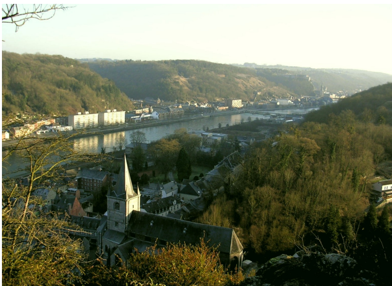
L'église de Bouvignes vue de Crève-cœur