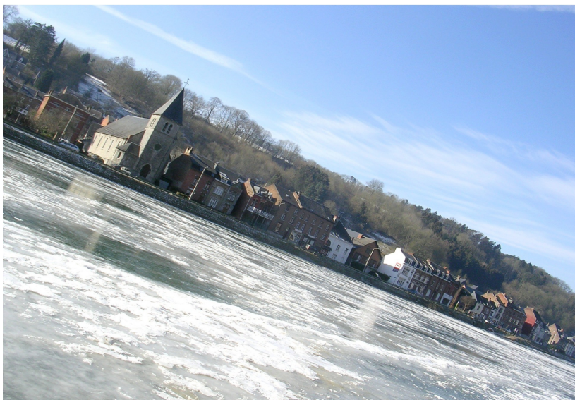
En haut, le pont saisi à partir du boulevard Churchill. En bas, Neffe et son église, vus du chemin de halage, derrière le casino.