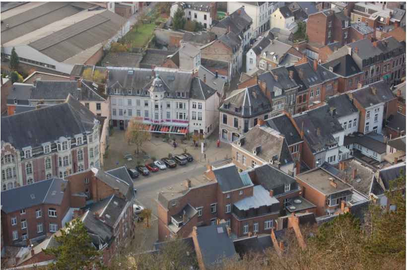
D'une rive à l'autre : En haut, les toits du collège de Belle-Vue, à hauteur d'objectif. En bas, vue aérienne de la place Saint Nicolas .