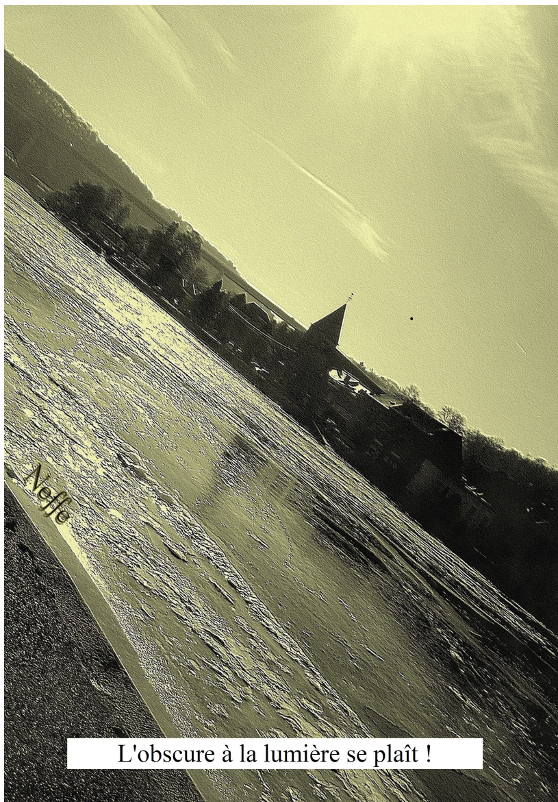
L'église de Neffe