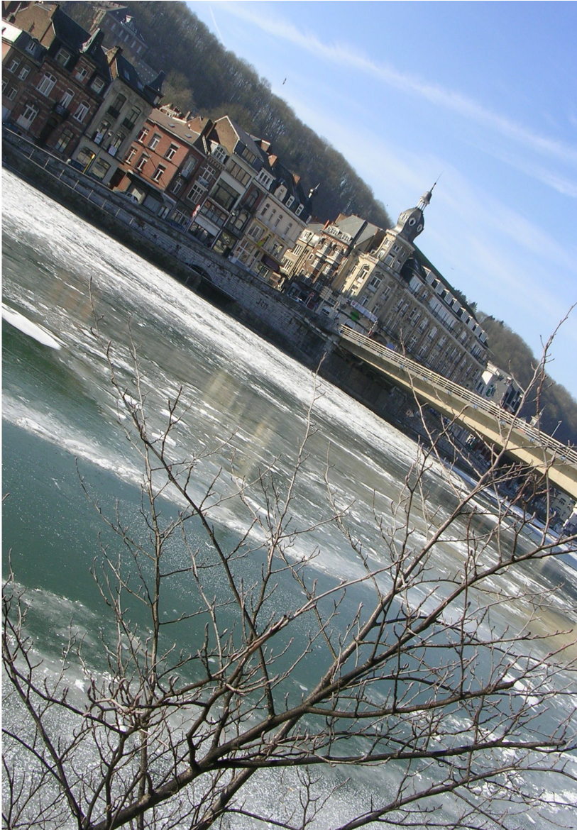
L'Hôtel des Postes, proue du quartier Saint Médard.