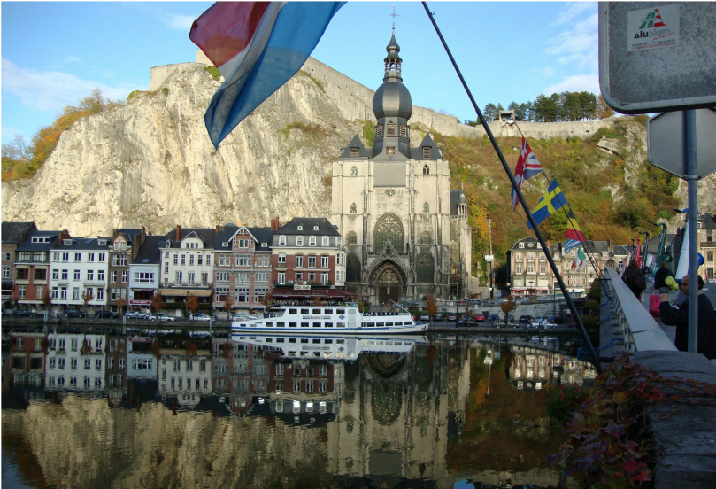
Le Bateau Bayard mouille l'ancre en face de la collégiale, au pied de la citadelle.