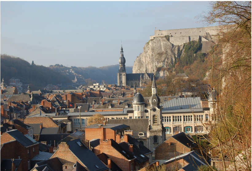
La citadelle flanquée de la collégiale vues d'entre les arbres en haut, alors qu'en bas, à l'avant plan, prônent le Centre culturel en partie caché par l'ancienne église Saint Nicolas et le quartier.