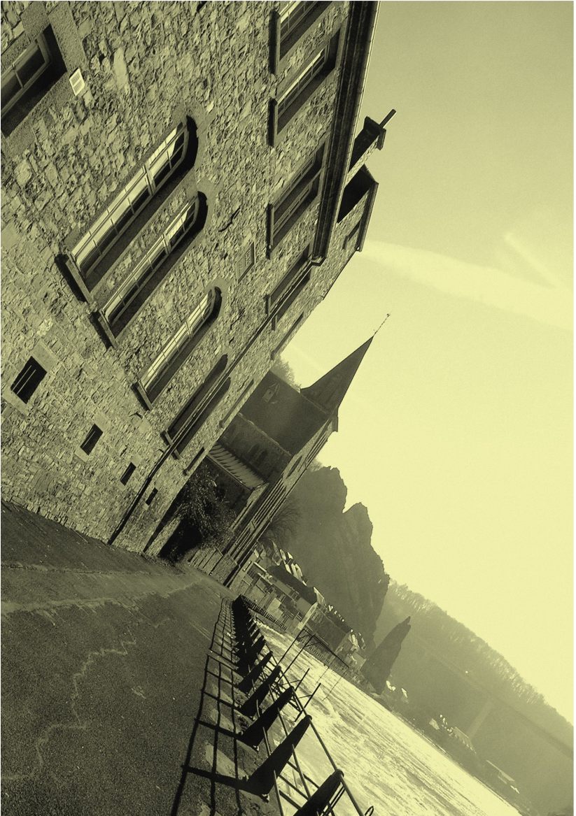
L'église du quartier du Rivage.