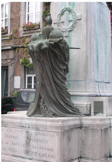
L'art des dinandiers sur la façade du Centre culturel, de l'architecture mosane et une partie du monument aux morts à l'hôtel de Ville.