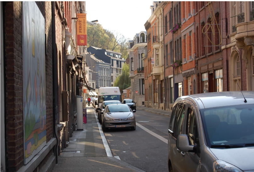
En haut, entre les trois clochers, des marins bravent le froid au quai Churchill. En bas, une journée ordinaire rue Léopold.