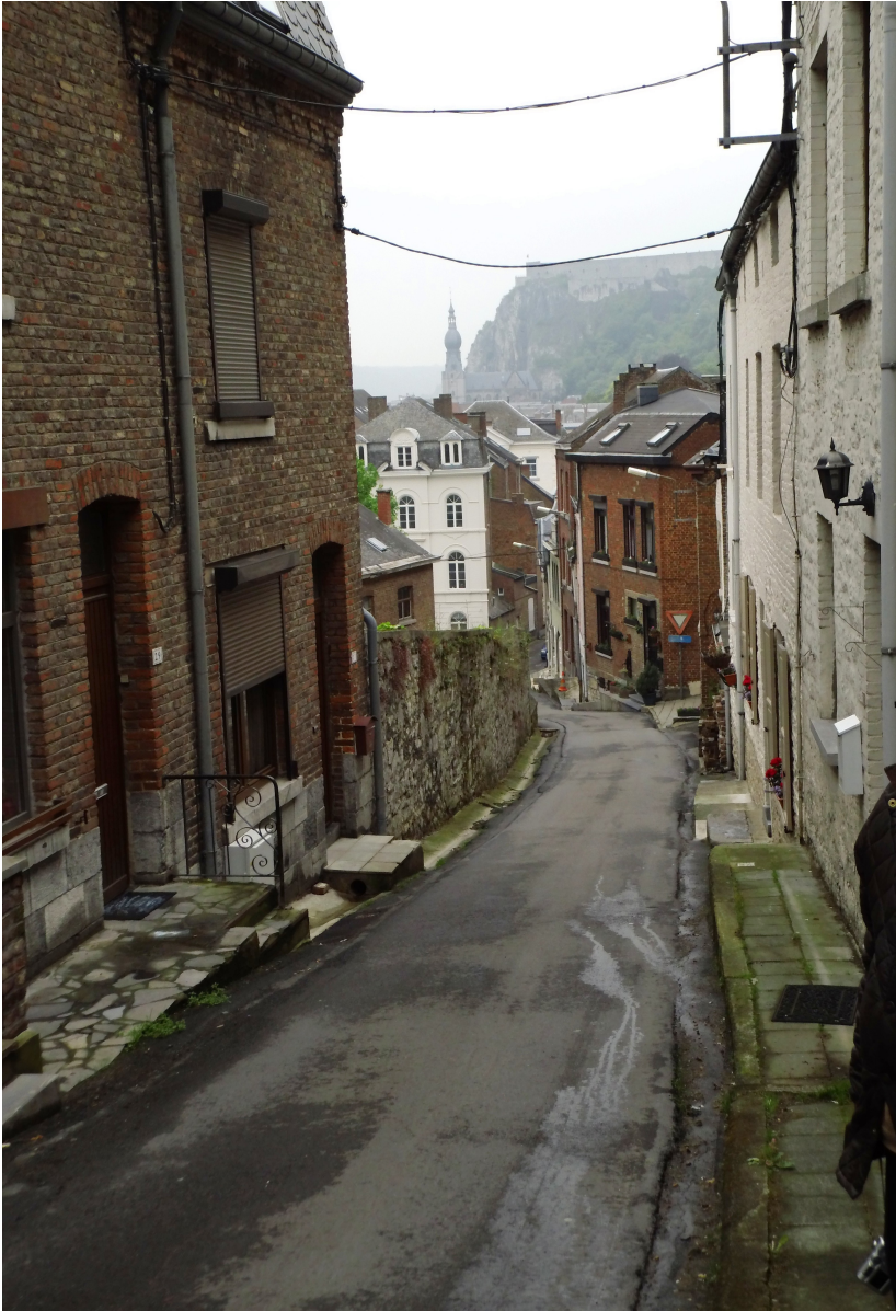
Chemin de la Montagne de la Croix