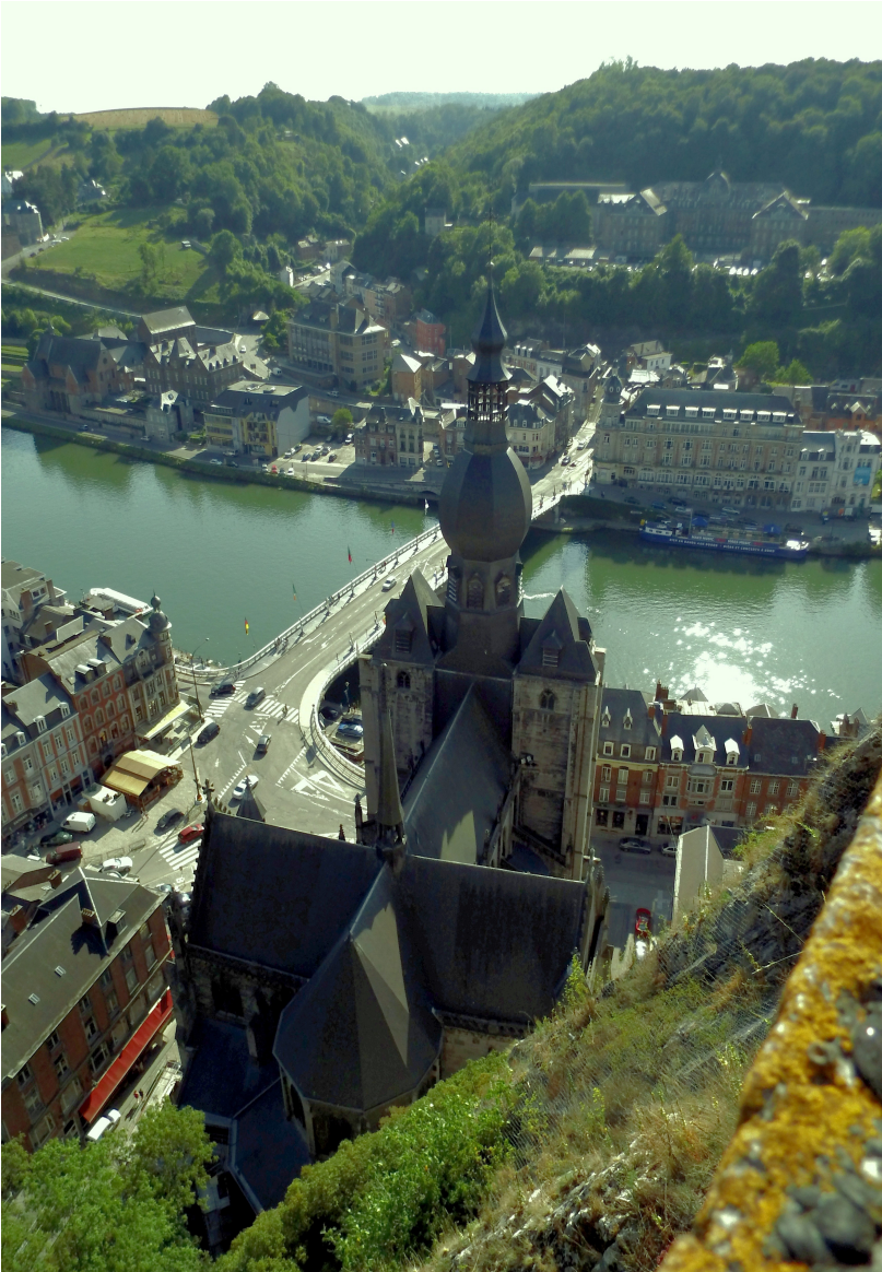
Vue prise de la citadelle.