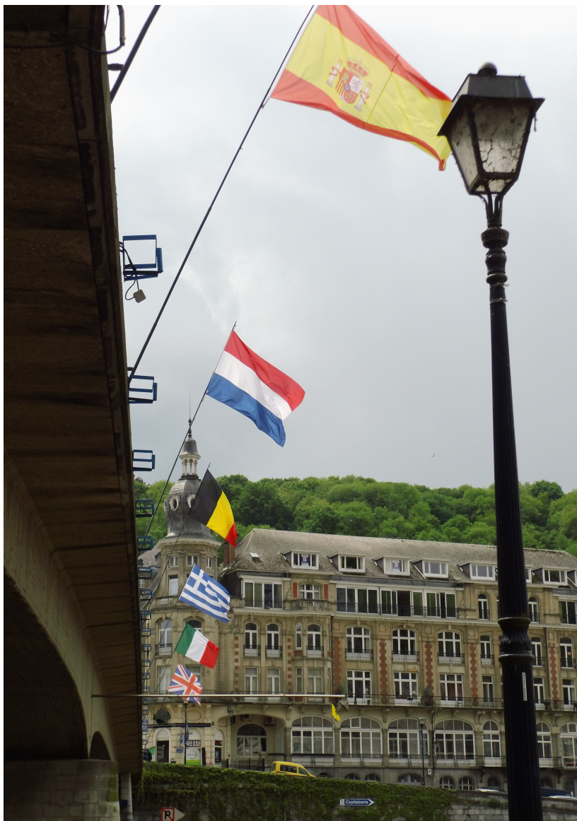
La résidence de l'Hôtel des Postes, construit au 19 ème , deux fois détruit au 20 ème , deux fois reconstruit !