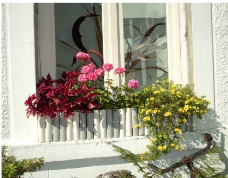
Cadeaux des habitants à leur ville.