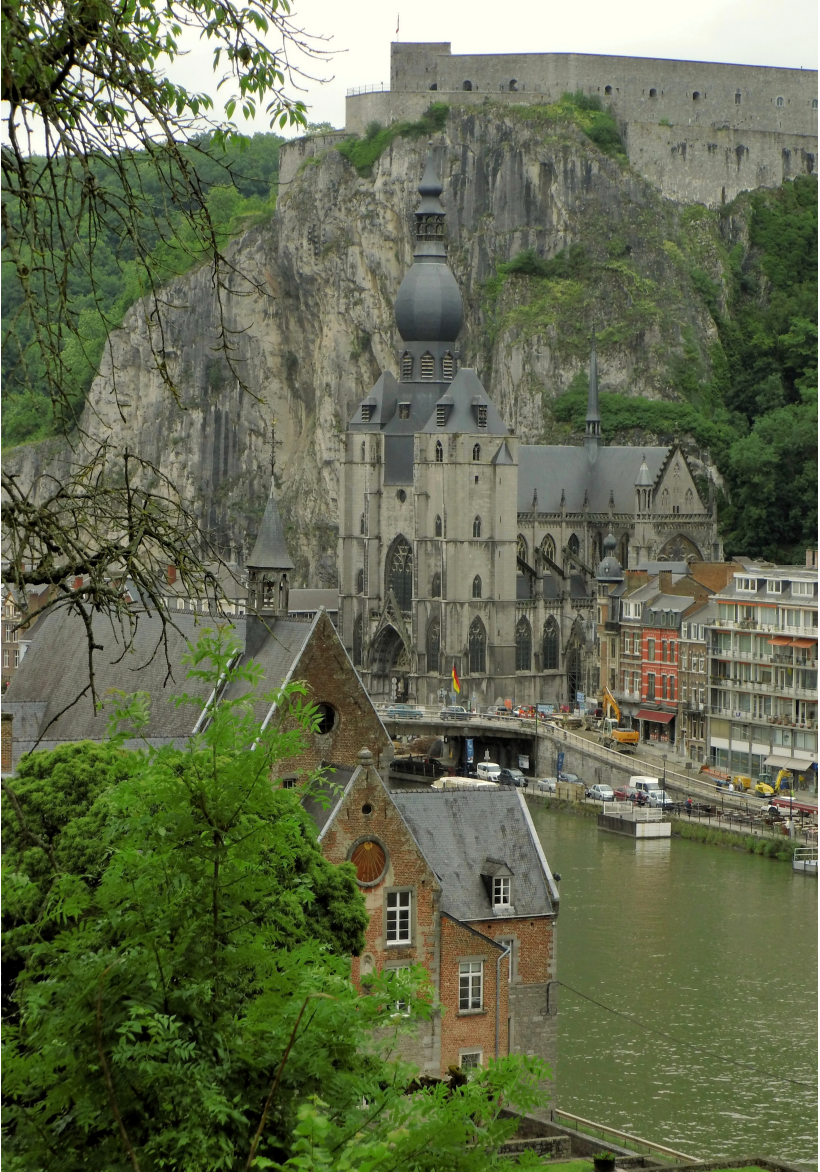
Vue prise de Bethléem