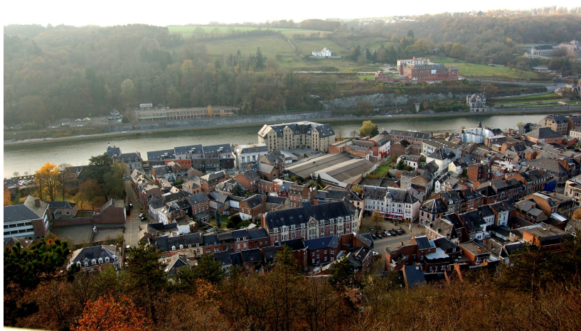
Photo du haut : Au milieu, entre l'eau et le chemin de fer, la Villa Mouchène est surplombée par le couvent de Bethléem, au dessus du rocher et tout en haut, à droite le collège de Belle-vue. Photo du bas, le quartier Saint Nicolas s'étale depuis la résidence des Brasseurs, devant la Meuse.