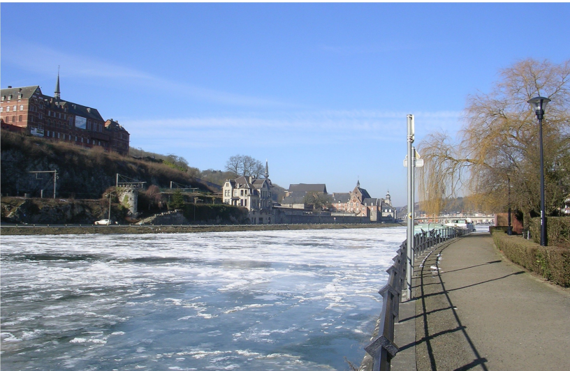
Février 2012, pour quelques jours l'hiver a changé la parure de la ville. En haut, vue de sous le pont en direction de Namur. En bas, vue prise dans la même direction, du chemin de halage, entre les Brasseurs et le casino.